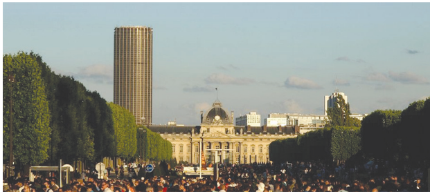
2 pav. Paryžiaus bokštas Tour Montparnasse (arch. J. Saubot, E. Beaudouin, U. Cassan, L. Hoym de Marien)