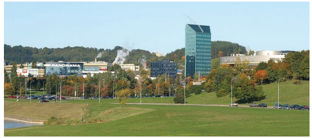
3 pav. Biurų pastatas Hanner Vilniuje, Geležinio Vilko gatvėje (arch. A. Ambrasas)

XX amžiaus pabaigos politiniai ir ekonominiai pokyčiai bei globalizacijos veiksniai paveikė ir posovietinių šalių aukštybinės statybos proveržį. Pereinamoju laikotarpiu vos per kelerius metus daugelis didžiųjų Rytų bei Vidurio Europos miestų patyrė žymius miestovaizdžio, mentalinio žemėlapi ir silueto pokyčius. Šis procesas neaplenkė ir didžiųjų Lietuvos miestų. Pirmąja šiuolaikine erdvinės struktūros dominante laikytinas biurų pastatas Hanner Geležinio Vilko gatvėje (arch. A. Ambrasas, 2000 m.; 3 pav.), tapęs atskaitos tašku visos šalies aukštybinių pastatų statyboje. Panašiai kaip dangoraižis Uhispank Talino centre (arch. R. Puusep, 1999 m.), pristatęs naująją Estijos aukštumi-