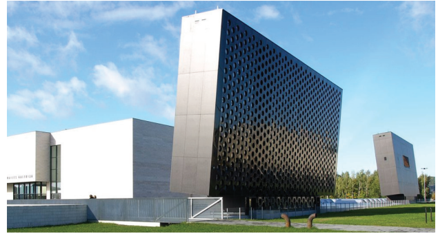
5 pav. Naujieji Lietuvos nacionalinės galerijos korpusai (arch. A. Bučas, D. Čaplinskas, G. Kuginis, Vilnius)

Išskirtiniais ženklais taip pat gali būti skulptūros, meninės instaliacijos, monumentai, fontanai, gatvės baldai ar smulkios pastatų detalės (pavyzdžiui, durys ir net jų