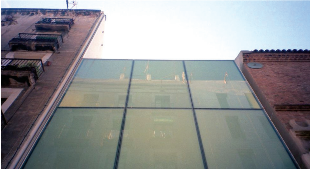
4 pav. Barcelonos universiteto Informacijos fakulteto stiklinio fasado fragmentas (arch. Freixas, Miranda, Bou, Gonzalez Architects )

Fig. 4. A glass facade fragment of the Faculty of Information Science, (designed by “Freixas, Miranda, Bou, Gonzalez Architects”)