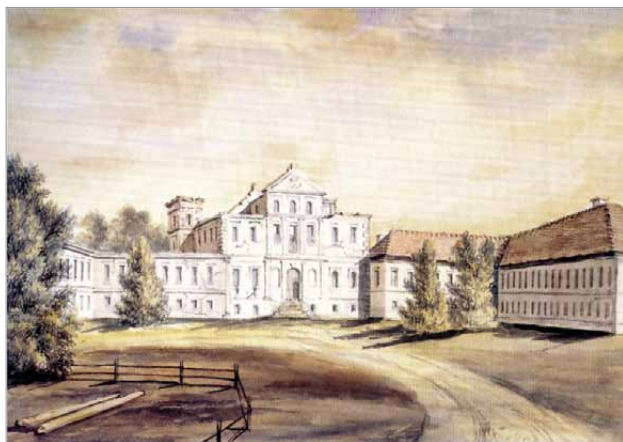
1 pav. Jiezno dvaro rūmai, 1875–1877 m.

XVII–XVIII a. sandūroje susilpnėjus valdovo dvaro įtakai LDK, vietos didikų dvarai tapo politiniais ir kultūriniais centrais. Iškilio Pacų bei Sapiegų giminės, mecenavusios kilmingųjų estetinį skonį bei troškimus reprezentavusius brandžiojo baroko architektūros ansamblius. XVII a. pab. Vilniuje pastatyti Sapiegų rūmai Antakalnyje, kartu su parku ir Trinitorių bažnyčia bei vienuolynu sudarantys baroko stiliškos išplėtos paradinės