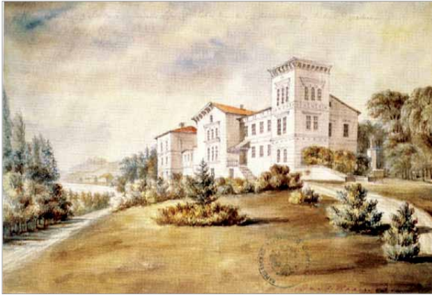
3 pav. Belvederio dvaro rūmai, 1875 m.