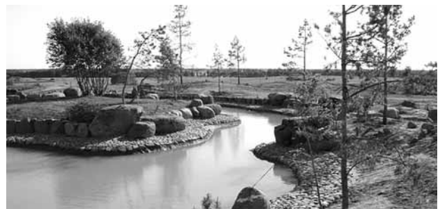
3 pav. Tinkamos rekreacinės aplinkos formavimas

Vienas nepalankiausių bruožų pastatų santykio su žaliomis, užstatytais teritorijomis požiūriu yra stambūs, masyvūs pastatų tūriai. Masyvios architektūros pavyzdžiai tiesmukai įsirežė į vietos kraštovaizdį ir užgožė gamtinius elementus bei pažeidė vietos mastelį. Per dideli įmantrių modernių formų statiniai gamtinėje aplinkoje sudaro „netaktišką“ konkurenciją tarp aplinkos pastatų. Teigiamai iš visų penkių objektų vertinčiau tik kuriamą japoniško stiliaus parką su rekreaciniais objektais (3 pav.).