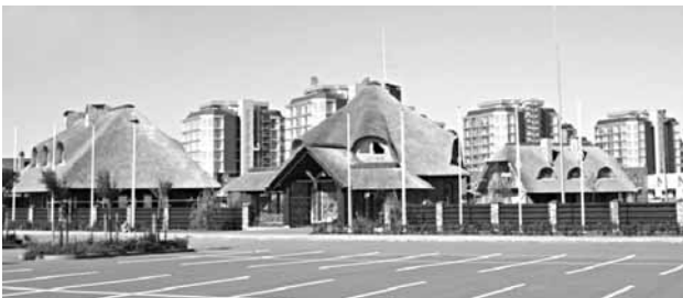
2 pav. Rekreacinės architektūros kontrastai Šventojoje

Vienas iš svarbiausių užmiesčio rekreacinių kompleksų pranašumas – teikiamų rekreacinių paslaugų įvairovė, išskirtinė gamtinė aplinka, teritorijos dydis. Taip pat būtina paminėti, kad šie kompleksai savotiškai paskirsto rekreacinių objektų koncentraciją. Dėl to, kad yra tokių kompleksų, rekreacinių paslaugų gaunama ne tik pačiose pajūrio gyvenvietėse (Palanga, Šventoji), bet ir atokiau, taip pat išplečiama paslaugų įvairovė. 2 pav. pateikti rekreacinės architektūros kontrastai Šventojoje.